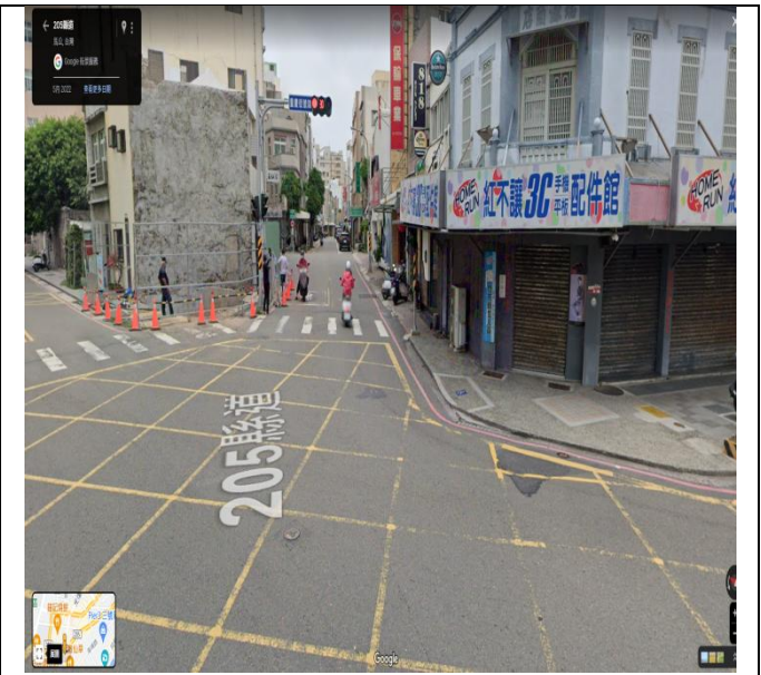
新生路自民福路至民生路口及照片