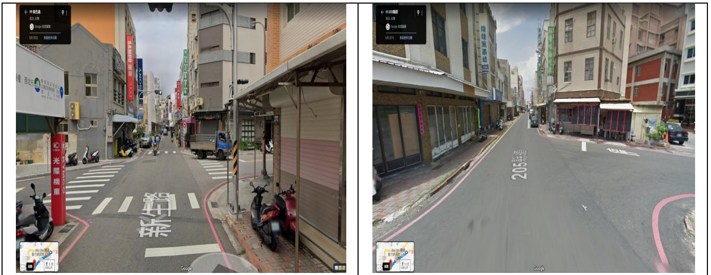
新生路自新村路至民福路口及照片